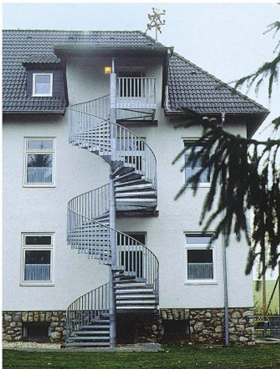
Abb. 8 Geländer mit engem Stababstand (max. 120 mm) und Rohrhandlauf