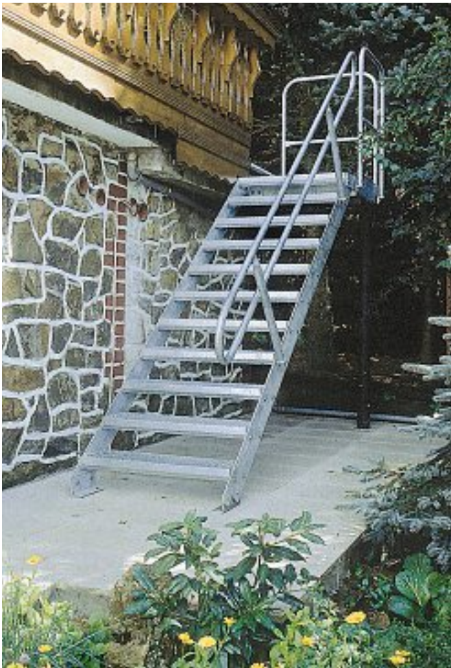
Abb. 12 Doppelwangentreppe, Normalgeländer und Austrittspodest (Leun/Wetzlar)