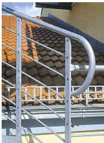
Abb. 4 Rohrhandlauf Stahl \varnothing 33 oder 42 mm