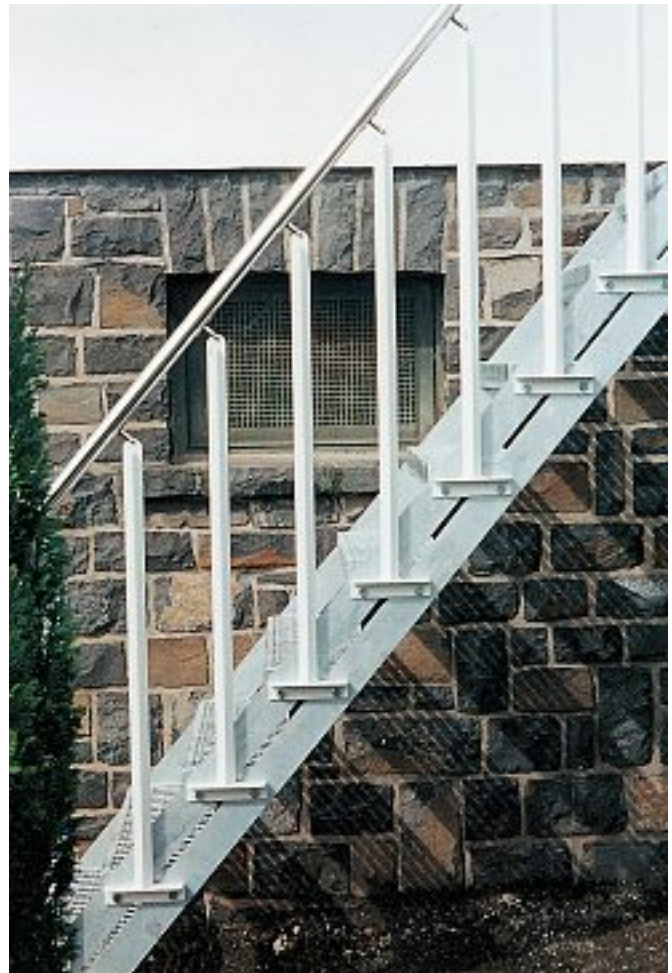
Abb. 13 Neigungsverstellbare Wange mit permanent senkrecht stehenden Geländerpfosten