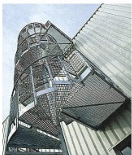
Abb. 6 Mit Rohrhandlauf und Geländerfüllungen aus INDURO-Stahlgitterrosten. Masche gem, Druck Nr. 91.