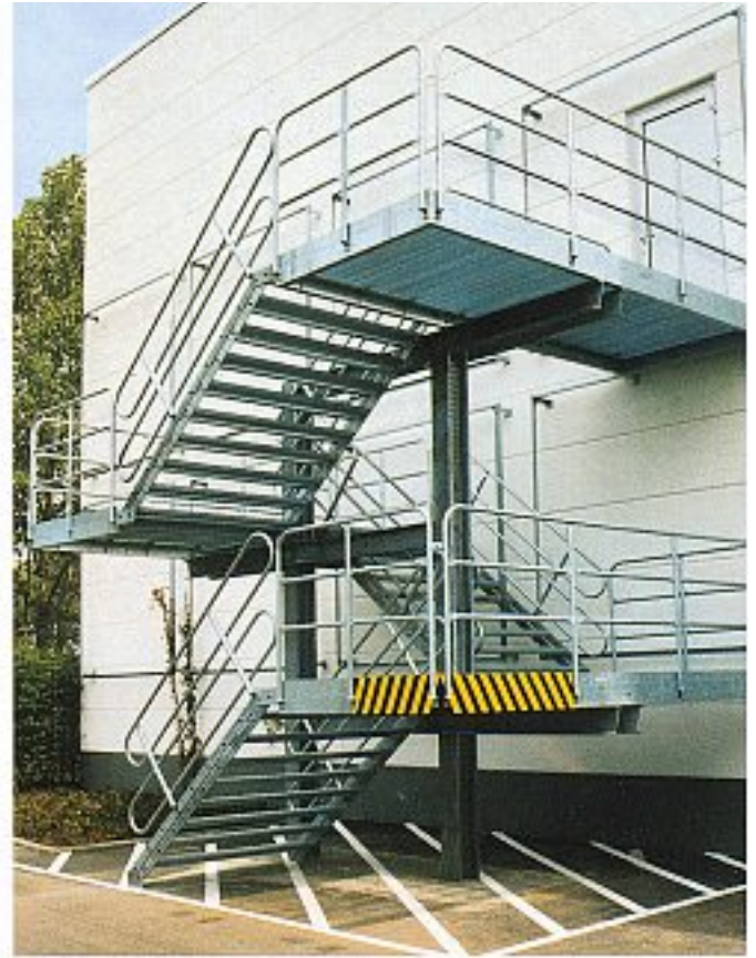
Abb. 10 Zweistöndertreppen, Normalgeländer, Laufbreite 1.500 mm, 3-läufig (Cottbus)