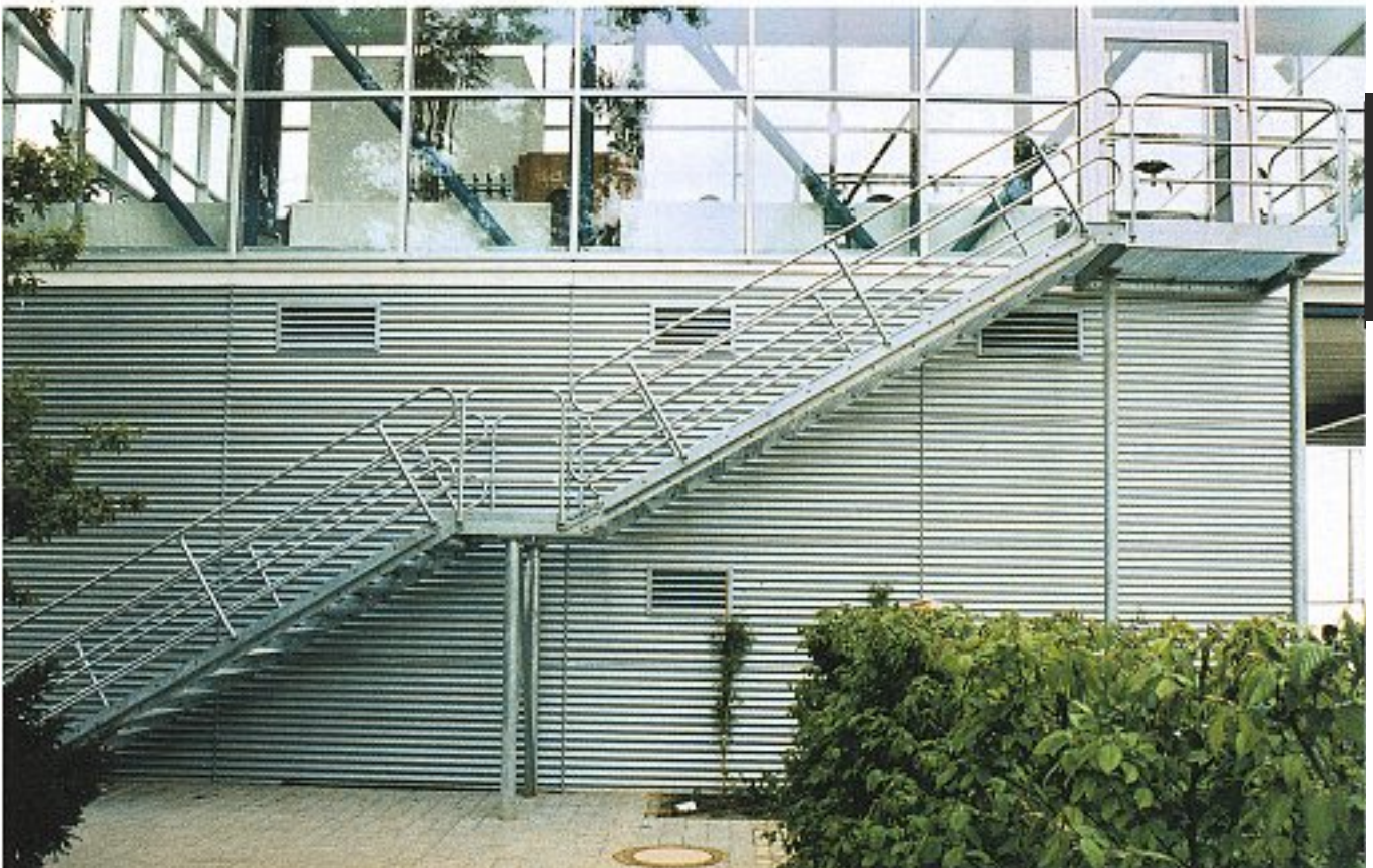
Abb. 11 Doppelwangentreppe mit Zwischenpodest und Austrittspodest, 2-läufig (Cottbus)