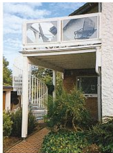
Abb. 5 mit kindersicherem Geländer, pulverbeschichtet und Edelstahlhandlauf