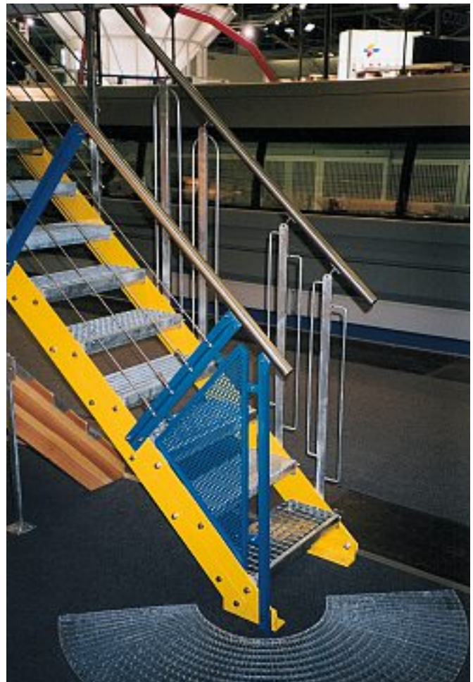
Abb. 15 Messetreppe mit Lochblechfüllung, Edelstahlbrahtseilen und verschiedenen Geländervarianten, neigungsverstellbar