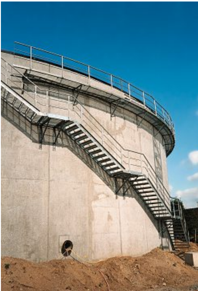
Abb. 14 Mehrläufige Tankmanteltreppe inkl. Konsolen und Podesten