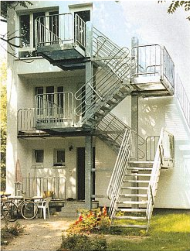
Abb. 9 Zweistöndertreppe mit engem Geländer, 4-läufig (Langen/Darmstadt)