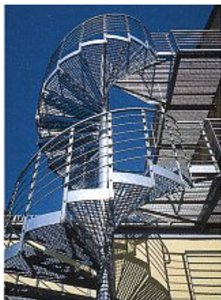
Abb. 3 mit 6 Kniegurten \varnothing 10 mm