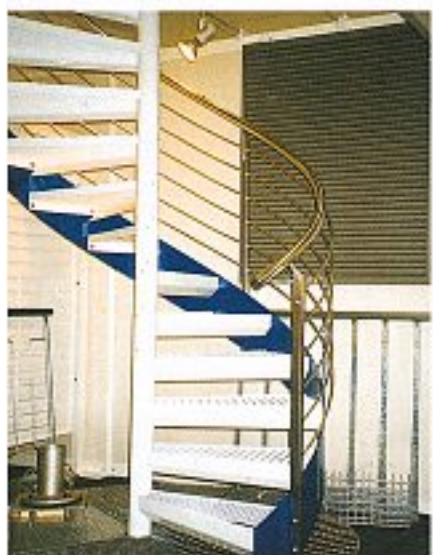
Abb. 7 Spindeltreppe, pulverbesch. Stufenblende + Edelstahlgeländer auf unserem Messestand